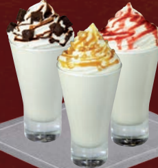
Sundae parfum vanille, accompagné de topping au choix : Sauce chocolat ou Sauce fruits rouges ou Sauce caramel au lait, pépites de noisettes caramélisées

Vanilla-flavoured sundae, with a choice of topping : Chocolate Sauce or Red Berry Sauce or Milk Caramel Sauce, crushed caramelised nuts